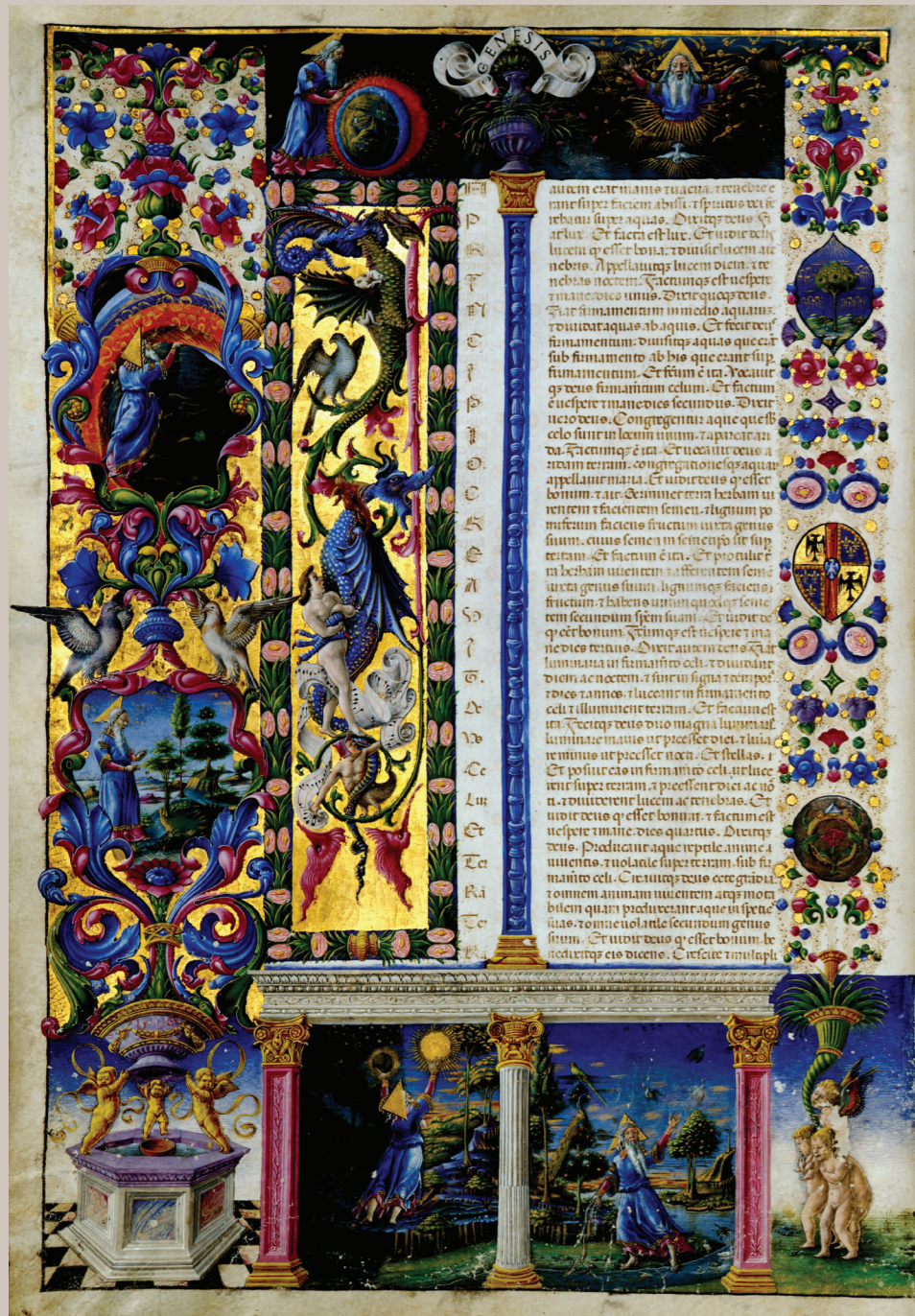
Modena, Biblioteca Estense Universitaria, Lat. 422=Ms. V.G.12, c. 5v